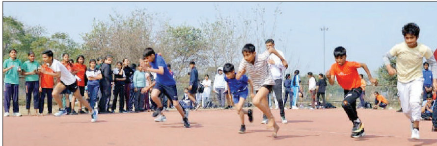
सोनीपत। राजीव गांधी खेल स्टेडियम में दौड़ लगाते रकूलों के विद्यार्थी।

खेलों में प्रतिभागिता बढ़ाने पर ध्यान केंद्रित किया है। विद्यार्थियों को खेलों के प्रति प्रोत्साहित करने के लिए 4 पीएमश्री राजकीय विद्यालयों में बहुउद्देशीय भवन (मल्टीपरपज खेल हॉल) का विस्तार करने, खेल मैदानों का स्थिति में सुधार करवाने या विस्तार करने के निर्देश दिए गए हैं। इसका उद्देश्य इन विद्यालयों में आउटडोर व इनडोर खेल सुविधाओं की व्यवस्था करवाना है, ताकि पढ़ाई के साथ विद्यार्थियों को खेलों में भी निपुण बनाया जा सके।