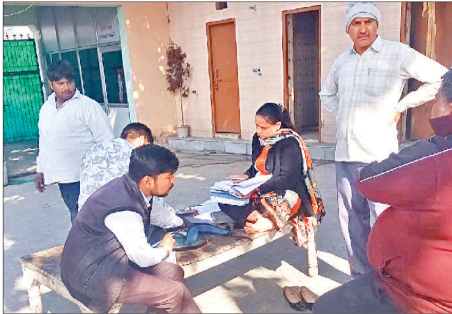
सोनीपत। वेस्ट रामनगर स्थित सर्वजातीय चौपाल में शिविर के दौरान नगर निगम कर्मचारियों को दस्तावेज जमा करवाते लोग।

शहर में नगर निगम के अंतर्गत आने वाले विभिन्न वार्डों में पेयजल व सीवर कनेक्शन को वैध कराने की प्रक्रिया करीब एक माह से जारी है। अब तक 1000 से ज्यादा लोगों ने अपने कनेक्शन वैध करवाने के लिए निगम कर्मचारियों को अपने आवेदन जमा करवाए हैं। नगर निगम ने मंगलवार को वार्ड-17 के वेस्ट रामनगर स्थित सर्वजातीय चौपाल व वार्ड-1 के कामी रोड स्थित बाबा धाम मंदिर के पास सैनीपुरा धर्मशाला में शिविर लगाया। शिविर में लोगों के पेयजल व सीवर कनेक्शन वैध कराने के लिए दस्तावेज जमा किए गए। दोनों जगह शिविर के माध्यम से कुल 42 लोगों ने अपने दस्तावेज जमा करवाए। निगम अधिकारियों ने बताया कि फिलहाल 24 फरवरी तक शिविर के माध्यम से लोगों के दस्तावेज जमा किए जाएंगे। अब तक निगम को 1000 से ज्यादा आवेदन प्राप्त हो चुके हैं। इसके बाद लोगों को फाइल नंबर मोबाइल पर भेजा जाएगा और निगम कार्यालय में फीस जमा करवाने के लिए बुलाया जाएगा। निगम की ओर से 18 फरवरी को अभियान के