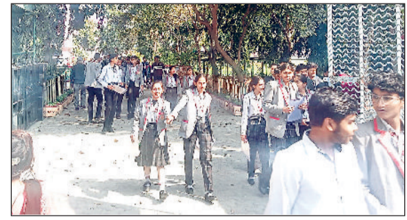
सोनीपत। परीक्षा केंद्र पर पेपर के बाद खुशी से झूमते हुए बाहर आते विद्यार्थी।

में कक्षा 10वीं व 12वीं के करीब 20800 विद्यार्थियों के लिए 33 परीक्षा केंद्रों बनाए गए हैं। इस वर्ष विद्यार्थियों की सुविधा के लिए क्षेत्र अनुसार आसपास 3 नए परीक्षा केंद्र भी बनाए गए हैं। परीक्षा को लेकर केंद्रों पर सुरक्षा के कड़े प्रबंध किए गए हैं। इन पर कड़ी सुरक्षा व्यवस्था के बीच परीक्षाएं संचालित की जा रही हैं। जिले में बनाए गए परीक्षा केंद्रों पर मंगलवार को कक्षा 10वीं के विद्यार्थियों ने स्टैंडर्ड व बेसिक गणित पेपर दिया, जबकि कक्षा 12वीं से संबंधित विषयों के विद्यार्थी नहीं थे। सभी केंद्रों पर शांतिपूर्ण तरीके से पेपर संपन्न हुआ।