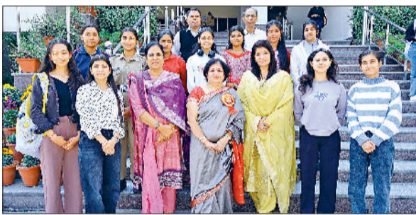
सोनीपत। जीवीएम गर्ल्स कॉलेज में विजेता विद्यार्थियों के साथ प्राचार्या एवं अन्य।