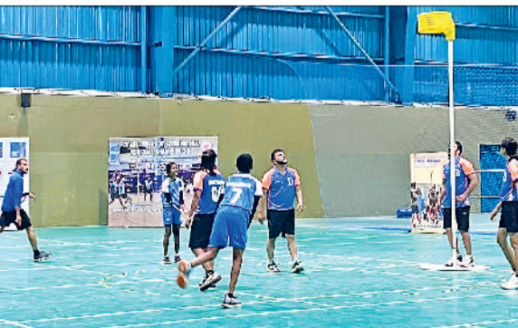
सोनीपत। पंजाब के फगवाड़ा स्थित लवली प्रोफेशनल यूनिवर्सिटी में कोर्फबाल खेल का अभ्यास करते खिलाड़ी।