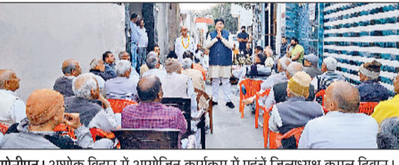
सोनीपत। अशोक विहार में आयोजित कार्यक्रम में पहुंचे जिलाध्यक्ष कमल दीवान।

■ अशोक विहार में आयोजित कार्यक्रम में जिला अध्यक्षों ने चुनावी रणनीति पर की चर्चा