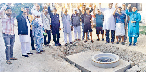
सोनीपत। मेनहोल के पास विरोध प्रदर्शन करते स्थानीय निवासी।

पुलिस लाइन के पीछे डाली जा रही सीवरेज पाइपलाइन का कार्य लंबे समय से अधूरा पड़ा है, जिससे क्षेत्रवासियों और राहगीरों को भारी परेशानियों का सामना करना पड़ रहा है। अधूरा कार्य आवागमन में बाधा बना हुआ है, वहीं स्वच्छता व्यवस्था भी चरमराती नजर आ रही है। स्थानीय लोगों के अनुसार सड़क को खोदकर बीच में ही छोड़ दिया गया है। वर्तमान स्थिति में वहां से केवल किसी तरह एकल दोपहिया